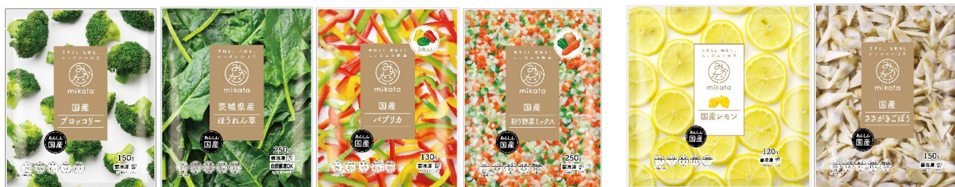
&lt; mikata の人気商品 &gt;